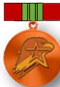
Бронзовый знак юнармейской доблести