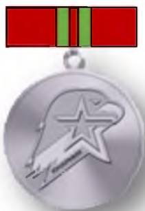
Серебряный знак Юнармейской доблести