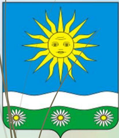
ГЕРБ ОТРАДНЕНСКОГО СЕЛЬСКОГО ПОСЕЛЕНИЯ (ТИХОРЕЦКИЙ РАЙОН)

Образ ромашки используется в гербах разных стран и городов. Цветы ромашки символизируют отраду, радость, красоту, любовь, возрождение.