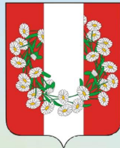
ГЕРБ БУРАКОВСКОГО СЕЛЬСКОГО ПОСЕЛЕНИЯ