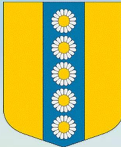
ГЕРБ ИЛЗЕНСКОЙ ВОЛОСТИ, ЛАТВИЯ