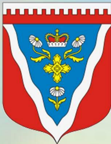
ГЕРБ ПОСЕЛКА РОМАШКИ, ЛЕНИНГРАДСКАЯ ОБЛ.