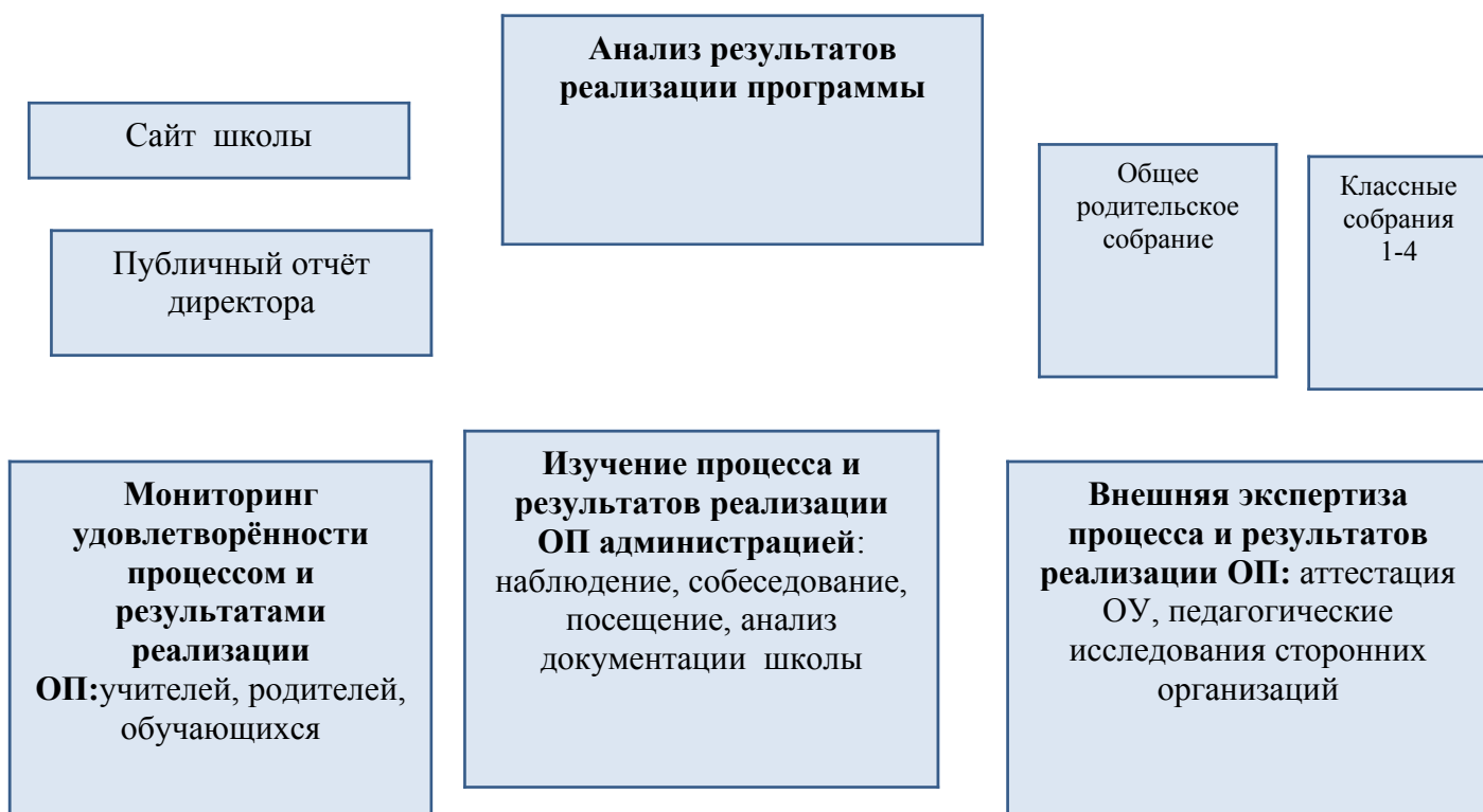
Схема показывает механизм обеспечения общественного участия и учета интересов, потребностей участников образовательного процесса при разработке и реализации образовательной программы.

Школа презентует публичный отчет на основе мониторинга результатов реализации образовательной программы, используя для этого, в том числе, и данные независимой общественной экспертизы и результаты проверки соответствия образовательного процесса утвержденной образовательной программе школы, проводимой при аттестации образовательного учреждения.